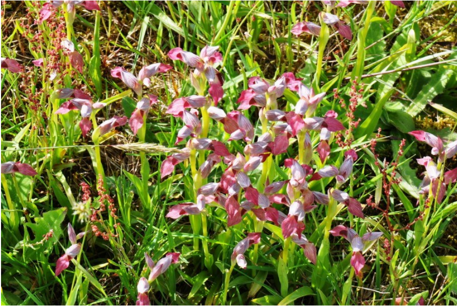
Serapias lingua : le Sérapias langue