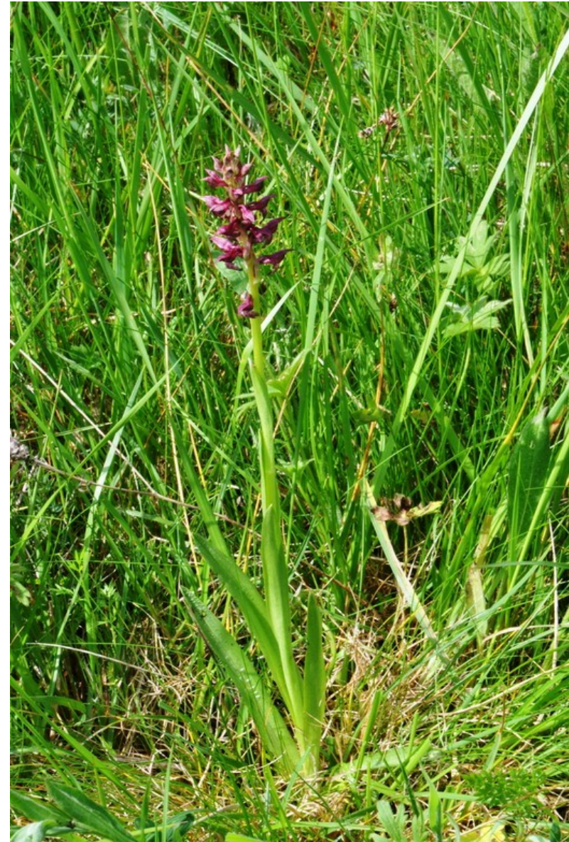
Anacamptis coriophora subsp coriophora : l'Orchis à odeur de punaise