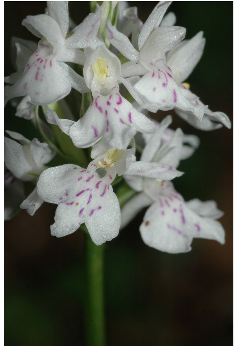
Dactylorhiza fuchsii : l'Orchis de Fuchs