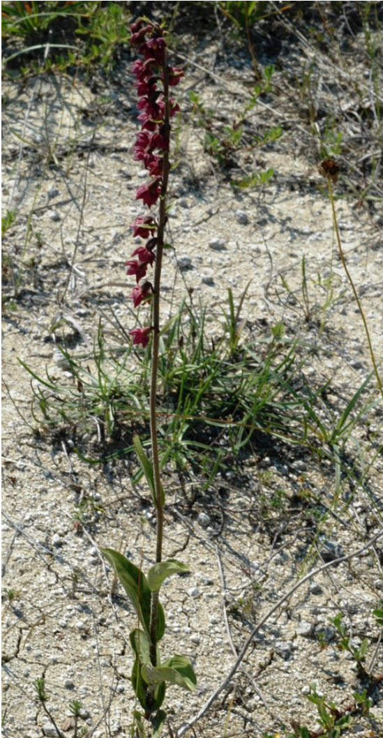
Epipactis atrorubens : l'Epipactis pourpre noirâtre