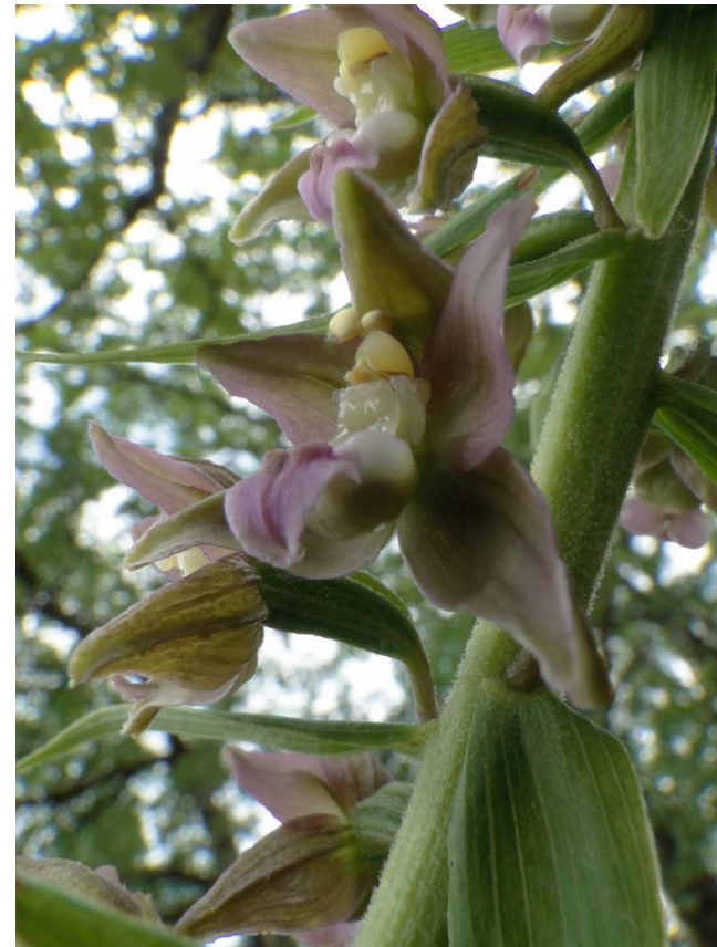
Epipactis helleborine subsp.helleborine, l'Epipactis à larges feuilles