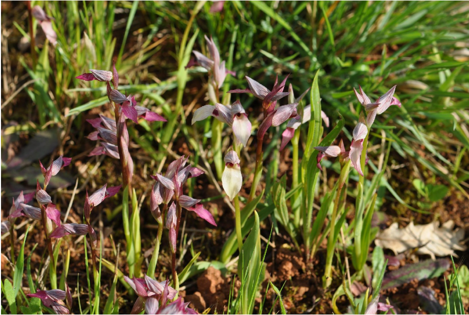
Serapias lingua : le Sérapias langue